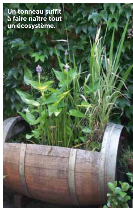
Un tonneau suffit à faire naître tout un écosystème.